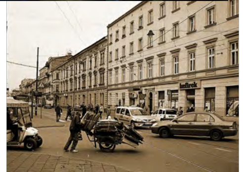
Die ersten drei Plätze des Fotowettbewerbs