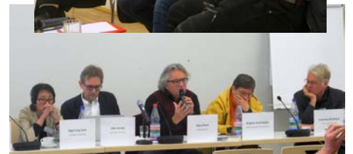
Eindrücke der Workshops zu 'Postkapitalismus' und 'Neosozialismus'